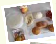
◀上海の某ホテルの朝食

隔離ホテルの食事が口に合わないという話をよく耳にします。中華料理は日本食に比べて味付けが濃く、油の使用料が多いため、「2週間食べ続けると飽きてしまう、胃腸の調子が優れない」という人が多いようです。ホテルによっては日本食などのデリバリーが不可なケースが多いので、日本から缶詰やレトルト食品を持ち込んだりすると良いでしょう。