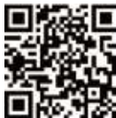
健康コード申請入口

全ての検査結果を取得後、直ちに右記QRコードにてアカウント登録をし、健康状態等を入力の上、必要書類をアップロードします。中国駐日本大使館・総領事館の確認を経て、“HDC”マークのグリーン健康コードが取得できます。