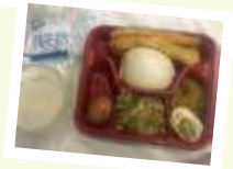
蘇州の▶某ホテルの夕食